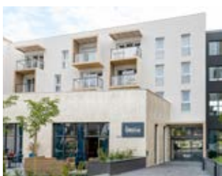
Résidence Kalone Noyal-Châtillon-sur-Seiche (35)