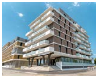
Résidence Avel Brest (29)