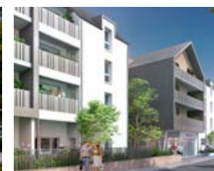
Résidence Dimezell Locudy (29) - 2025