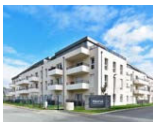
Résidence Blanche de Castille Trélazé (49)