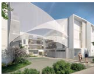
Résidence La Grand'Voile Royan (17)