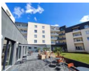
Résidence Béatrix Laval (53)