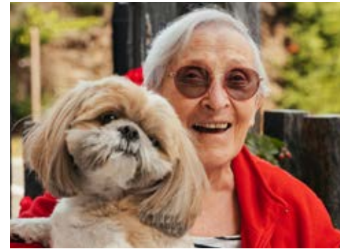
Tableau comparatif EHPAD/Résidences Services

Les Résidences Services sont des lieux conviviaux où l'atmosphère chaleureuse et familiale fait partie intégrante du concept. Cet environnement stimulant et riche est une source d'épanouissement et de bien-être. Il est beaucoup plus difficile à mettre en place en EHPAD du fait de l'état de santé de la plupart des résidents qui y sont accueillis.