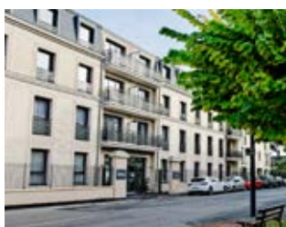
Résidence Epona Saumur (49)