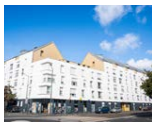
Résidence Steredenn Nantes (44)