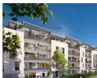
Résidence Aliénor Angers (49)