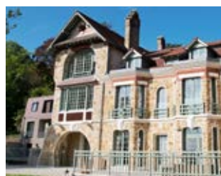
Résidence l'Aubrière Villennes-sur-Seine (78)