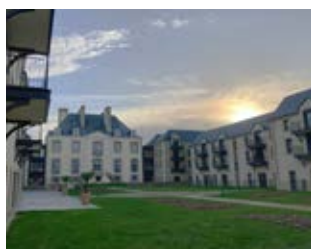
Résidence Hermine Vitré (35)