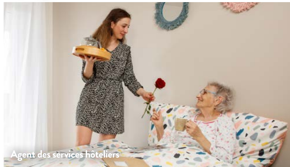
Agent des services hôteliers