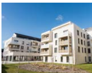
Résidence Odysée Cherbourg (50)