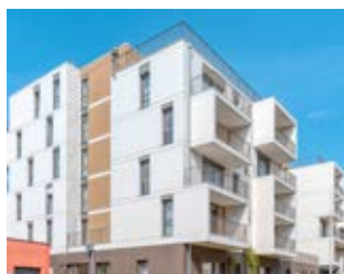
Résidence Olympe Loudéac (22)