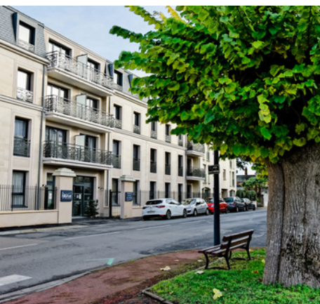
Résidence Epona à Saumur

Les professionnels sont tous très investis dans le secteur du grand âge mais l'accompagnement des personnes âgées nécessite du temps, que les ratios de personnel financés par les organismes de tutelles ne permettent pas d'offrir. Chez HEURUS, ce sont les résidents qui décident du temps de leur intervention dans l'accompagnement aux gestes de la vie quotidienne. « Nous ne rencontrons pas de difficultés à recruter du personnel sur nos SAAD car avoir la capacité de prendre le temps avec les résidents c'est ce que recherche les professionnels du grand âge. », ajoute la présidente.