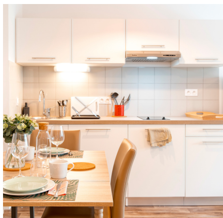
Appartement Heurus